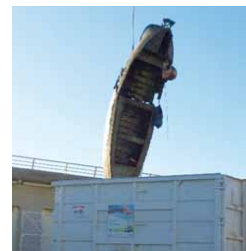
La SEPM qui a procédé à la campagne d'enlèvement des déchets dans le port de Fontvieille en décembre 2013 et janvier 2014 a récupéré 5,3 tonnes de déchets

Dans le cadre de sa concession, la Société d'Exploitation des Ports de Monaco (SEPM) réalise des campagnes de nettoyage des fonds sous-marins des deux ports. L'an dernier, la Direction de l'Environnement avait diligenté deux inspections sous-marines réalisées par la société Prodrive pour connaître l'état des fonds sous-marins des deux bassins portuaires.