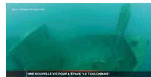
Immergée depuis 1992, cette épave de 27 mètres de long et pesant plus de 300 tonnes, gisait en pleine mer devant l'ancienne digue du port Hercule. Il est depuis toujours un spot pour les amateurs de plongée. Dorénavant, il sera également un lieu de recherche pour les scientifiques souhaitant étudier la faune et la flore des fonds marins de la Principauté.