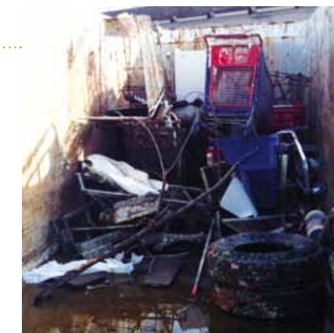
Par ailleurs, la DAM a travaillé avec la SEPM et la société CARREFOUR plus spécifiquement sur la problématique des caddies qui se retrouvent au fond du port de Fontvieille. Il s'agissait de mettre en œuvre des actions comme l'interdiction de sortir les caddies du Centre Commercial de Fontvieille et le ramassage par CARREFOUR des caddies se trouvant sur le périmètre portuaire.

Dans cette optique, le port de Fontvieille devait être nettoyé de ses macro-déchets. Un résultat pour le moins surprenant puisque ces déchets étaient essentiellement composés de caddies, d'épaves de navires et de matériels de musculation. Une tente de camping a même été retrouvée.