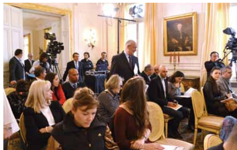
Le 3 avril dernier, le Ministre d'État, Michel Roger, a reçu la presse locale pour la conférence de presse mensuelle du Gouvernement.