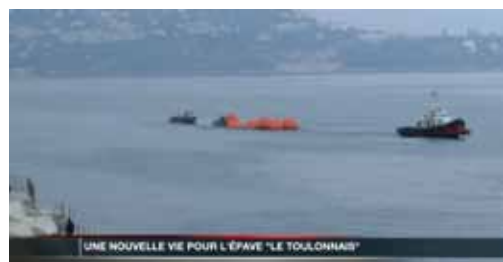
Cette opération s'est déroulée le vendredi 21 mars en deux temps : dans la première phase, il s'agissait de dégager le navire du fond du port. Dans un deuxième temps, il fallait remorquer l'épave encore immergée vers son site final au pied du Musée Océanographique.

Sur cette opération le Gouvernement a engagé 160 000 euros, hors dispositif de mouillage de 18 000 Euros qui doit permettre aux bateaux de plongée de s'amarrer sans avoir à utiliser leur ancre et ainsi préserver les fonds marins.