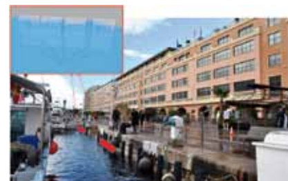
Le biohut est un habitat artificiel installé le long des quais et / ou sous les pontons flottants entre mars et octobre, période de colonisation des côtes. L'habitat est constitué d'une cage en acier remplie de coquilles d'huîtres, associée à une cage vide. En Principauté, les coquilles d'huîtres utilisées sont issues de l'écloserie de Fontvieille et constituent un moyen de traitement des déchets innovant.

Matérialisées par des cages métalliques remplies de coquilles d'huîtres, ces technologies innovantes appelées « biohut », ont été installées au mois de février dernier. Ce projet était mené dans le cadre d'un partenariat établi entre la Direction de l'Environnement, la Direction des Affaires Maritimes et la Société d'Exploitation des Ports de Monaco.