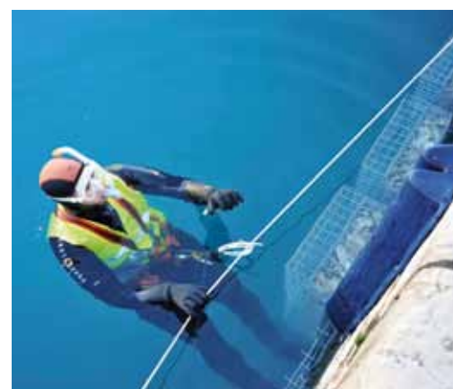
C'est la société ECOCEAN qui a procédé à l'installation des cages dans les ports de Monaco du 10 au 15 février 2014.