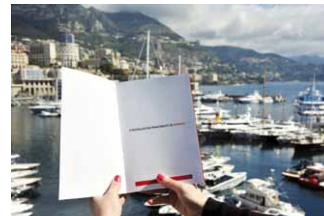
La brochure « S'installer en Principauté »

Accessible via le site www.spe.gouv.mc , il donne accès au calendrier des dates importantes et des grands rendez-vous professionnels organisés en Principauté et à l'étranger. L'Agenda recense en effet les manifestations sur invitation telles que les réunions d'adhérents, les Assemblées Générales, ainsi que les événements et conférences destinés à un plus grand public, les arrivées de croisières et les dates administratives à ne pas manquer. Au-delà de l'information qu'il donne à l'internaute, cet outil a pour objectif de créer un calendrier global en recensant les dates marquées par une rencontre professionnelle ou associative, afin de permettre à chaque acteur économique de la place qui souhaite organiser un événement de connaître en amont les dates déjà prises. Il pourra également partager avec le plus grand nombre les dates qui le concernent.