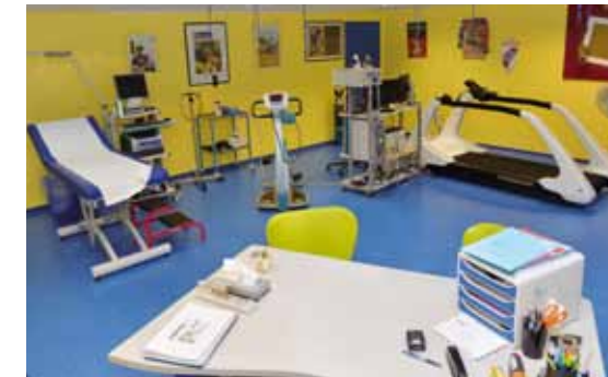
Pour certains sportifs de la Principauté, des tests plus approfondis peuvent être effectués grâce à l'équipement technique du Centre : épreuve d'effort sur vélo ou tapis roulant, calcul de la consommation d'oxygène à l'effort. Ils ne peuvent être réalisés qu'après consultation par un des médecins du C.M.S.

Cette obligation relevant d'une mesure de santé publique, la Principauté est dotée d'un Centre Médico-Sportif (C.M.S.), Service de l'État, qui a pour mission principale de dispenser, gratuitement, des visites médicales à toutes les personnes souhaitant exercer une activité spor-